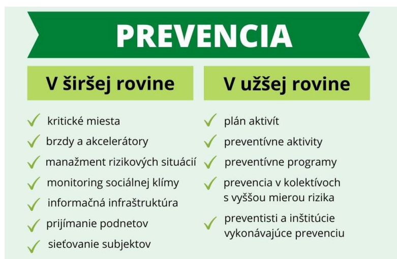
Obr. 1 Rozdelenie prevencie

Preveniu v kontexte tohto materiálu je možné vnímať v dvoch rovinách. Prevenca v širšej rovine predstavuje súbor systémových opatrení, ktoré eliminujú vznik šikanovania alebo spomaľujú jeho vývoj. Preventívne systémové opatrenia tiež umožňujú zachytiť príznaky šikanovania v počiatočných fázach, čo sa ukazuje ako kľúčové pri jeho riešení. Ako príklady prevencie v širšej rovine možno uviesť monitoring odľahlých častí školy, infraštruktúru pomoci, odstránenie pedagogických „zlovykov“, napr. ironizovanie, telesné tresty, sexuálne narážky a pod. Prevenca v užšej rovine je chápaná ako realizácia preventívnych činností – aktivít, programov, modulov a iných foriem, ktoré sú špecificky smerované na problematiku šikanovania.