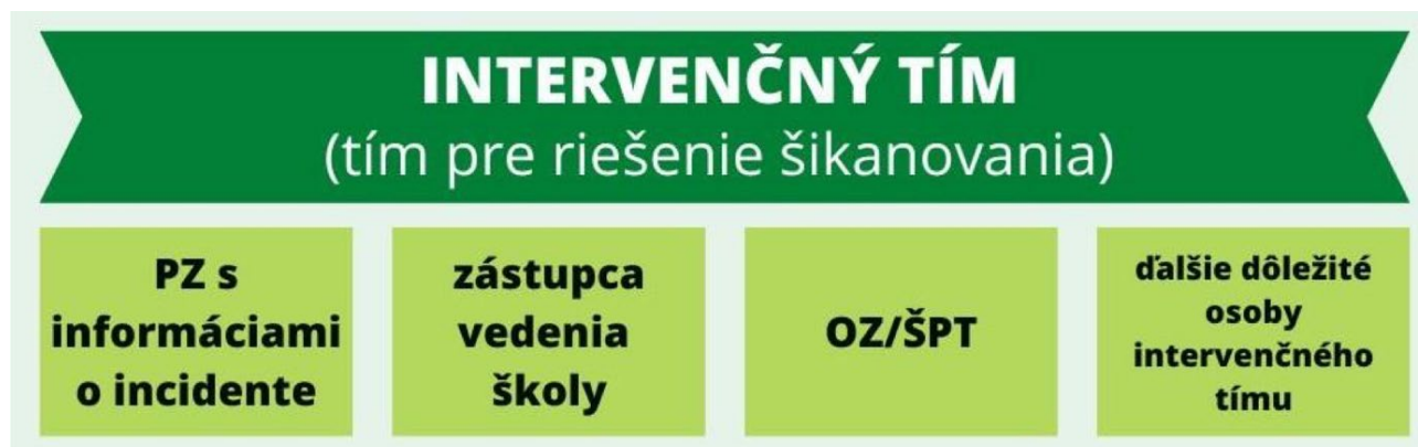
Obr.2 Zloženie intervenčného tímu

Mali by ho tvoriť zamestnanci školy, ktorí vedia o prípade najviac (zástupca vedenia školy, OZ, triedny učiteľ a pod.). Intervenčný tím navrhuje a zabezpečuje odborný postup pri riešení. Úloha OZ v rámci tohto tímu spočíva najmä v odbornom vedení prípadu, koordinácii postupov šetrných k šikanovanému, šikanujúcemu, kolektívu a v sieťovaní spolupráce s inými inštitúciami a odborníkmi. Vedenie školy je nápomocné v organizačných záležitostiach a dozerá na to, aby pri riešení prípadu neboli prekročené kompetencie školy.