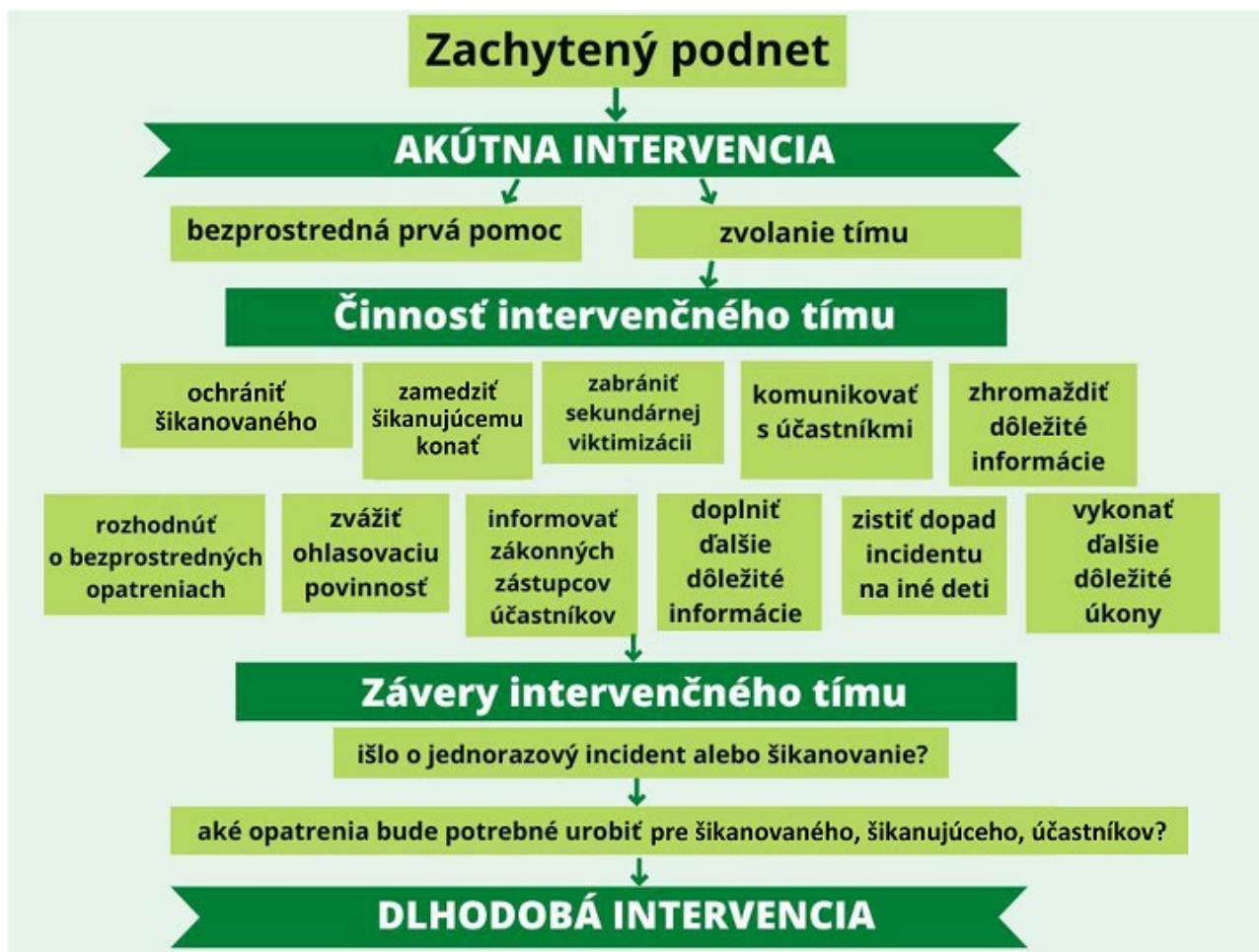
Obr.3 Akútna intervencia

Obrázok 3 popisuje proces intervencie pri zachytenom podnete šikanovania. Je potrebné uviesť, že všetky vyššie uvedené možnosti prevencie a intervencie pri riešení šikanovania bežne v praxi nemusia nasledovať za sebou, ale môžu sa prekryvať alebo diať paralelne. Napríklad v situácii, keď sa v procese prevencie v škole odhalí šikanovanie, vyžaduje sa aj aktívna reakcia, a zároveň je potrebné vytvoriť podmienky pre dlhodobú intervenciu.